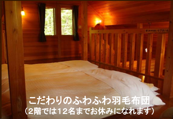
こだわりのふわふわ羽毛布団 (2階では12名までお休みなれます)