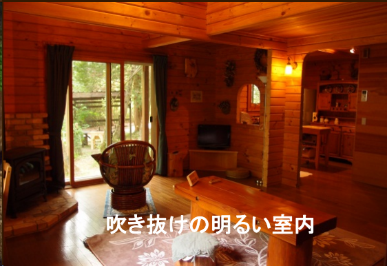
吹き抜けの明るい室内

木の香りいっぱいの開放感あふれるログハウス！ 贅沢なプライベート空間で、ご家族・お仲間と癒しの時間をお愉しみください。