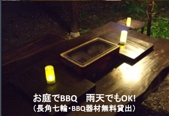
お庭でBBQ 雨天でもOK! (長角七輪・BBQ器材無料貸出)