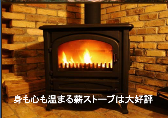
身も心も温まる薪ストーブは大好評