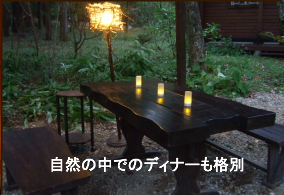
自然の中でのディナーも格別