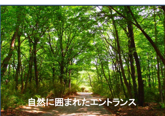
自然に囲まれたエントランス