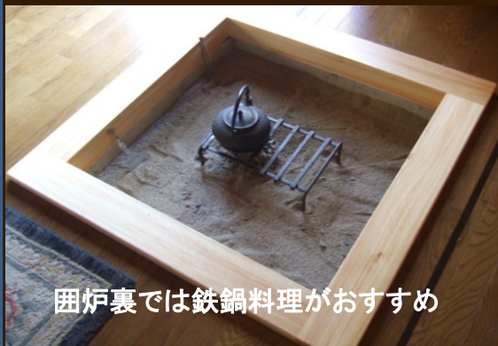
囲炉裏では鉄鍋料理がおすすめ